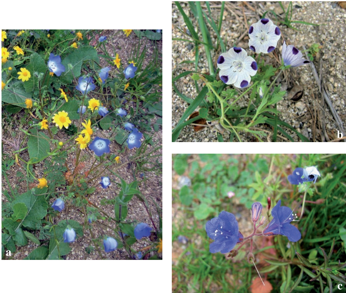
Figura 3. Flora exòtica present als marges del torrent de can Mestruc de Cabriels: a) Nemophila menziesii (flors blau clar) i Lasthenia glabrata (flors grogues); b) Nemophila maculata ; c) Phacelia parryi .

la Cerdanya i Alt Urgell, i dues més de genèriques, provinents de bases de dades fotogràfiques, fetes a Castelldefels i al riu Besòs. La localitat que indiquem al parc fluvial del Besòs possiblement sigui propera a la darrera. En aquest mateix indret també hi hem localitzat Verbena bonariensis i Eschscholzia californica .