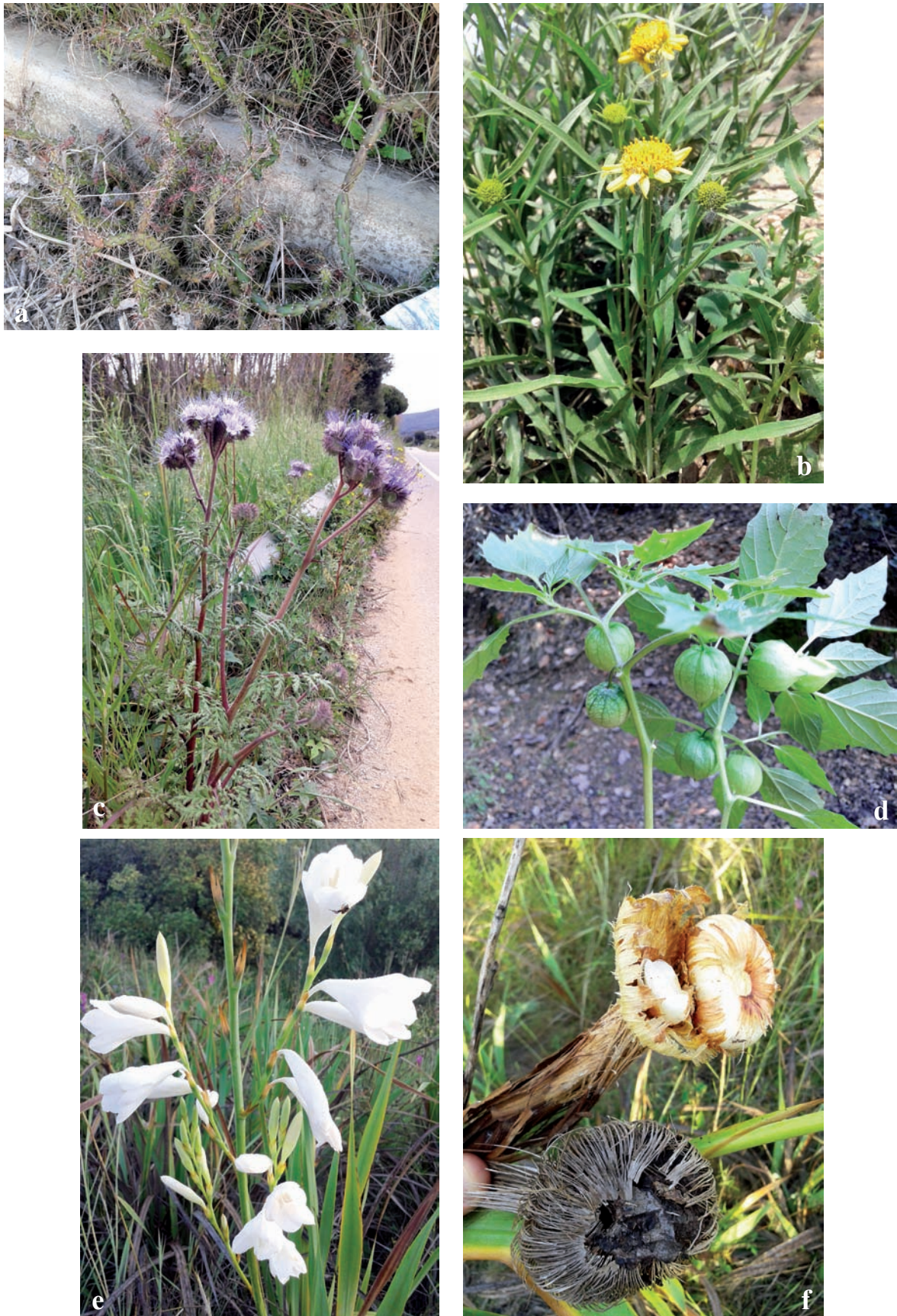
Figura 4. a) Opuntia aurantiaca als marges de la carretera BV-5031 al torrent de Vallveric. b) Pascalia glauca als marges de la riera Seca a la Llagosta. c) Phacelia tanacetifolia als herbassars del marge de la carretera B-502. d) Physalis ixocarpa al torrent de les Teixonerres de Santa Agnès de Malanyanes. e) Watsonia borbonica fa una taca molt densa sota el poblat ibèric de Burriac a Cabrera de Mar. f) detall del bulb de Watsonia borbonica .