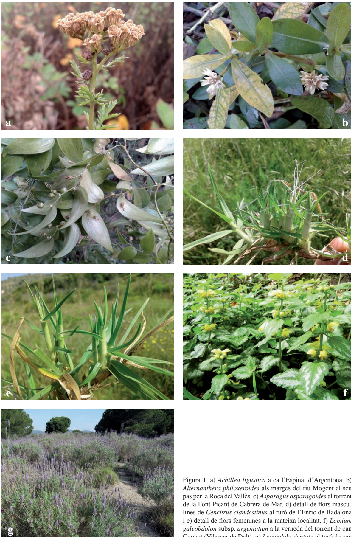
Figura 1. a) Achillea ligustica a ca l'Espinal d'Argentona. b) Alternanthera philoxeroides als marges del riu Mogent al seu pas per la Roca del Vallès. c) Asparagus asparagoides al torrent de la Font Picant de Cabrera de Mar. d) detall de flors masculines de Cenchrus clandestinus al turó de l'Enric de Badalona i e) detall de flors femenines a la mateixa localitat. f) Lamium galeobdolon subsp. argentatum a la verna del torrent de can Cuquet (Vilassar de Dalt). g) Lavandula dentata al turó de can Codina a Tiana.